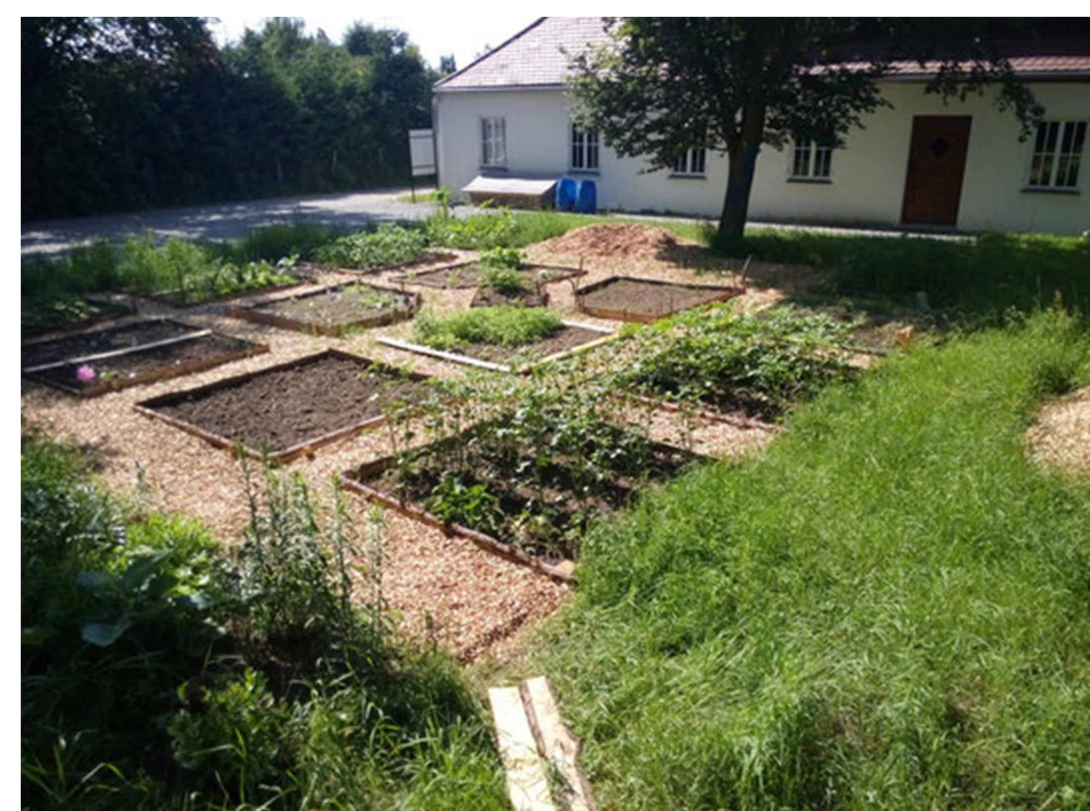
Der Mitmachgarten der Bürgerinitiative KERNiG